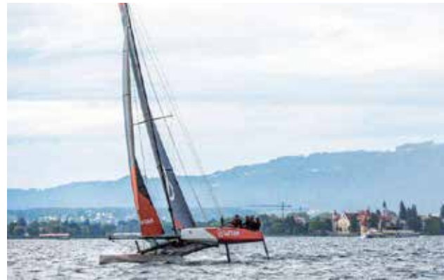
Ersegelt auf Anhieb den zweiten Platz bei der Rund Um: die „Safram“ vom Genfer See.

Bis auf der Höhe von Wasserburg hatte die „Safram“, nach wechselnden Führungen im Verlaufe des Ren-