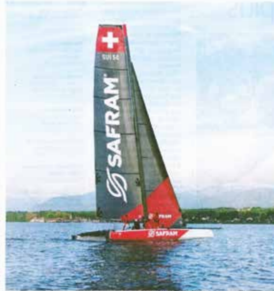
Après une saison 2015 idéale, l'équipage de Safram veut poursuivre sur sa lancée.

Avant d'attaquer ce challenge européen, les gars de Crans ont démarré les entraînements sur le Léman à la fin avril dans des conditions climatiques exécrables, plus proches des canicules de l'Atlantique que des belles en-