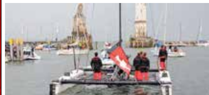
Bereit: die „Safram“ beim Auslaufen aus dem Lindauer Hafenbecken kurz vor dem Rund-Um-Start am Abend des 3. Juni.

Alles rund um die „Safram“ online www.facebook.com/saframsailing