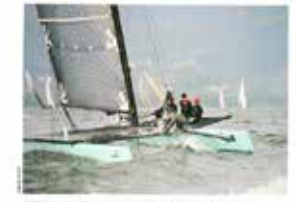
AVEC UNE PLACE AMBROS COMPLETE, L'ÉQUIPE NE SE REND

de changer de formule en fonction des tendances et ont vu leur participation chuter.» Pour Zimmerli, le déplacement depuis la Suisse centrale où il habite s'est avéré payant. Son Quam30 a trouvé suffisamment de vent pour pousser profiter de ses foies et entreprendre un viril de nuit. Il a passé la ligne en 11 e position, loin devant les autres bateaux de moins de 30 mètres.