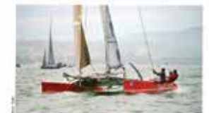
AVEC UN VENT FORT, LES BOULES SONT DANS LE GROUPE DE TÊTE, MAIS LE M2 SAFRAM NE SE REND PAS EN TÊTE, ET LE M2 SAFRAM NE SE REND PAS EN TÊTE