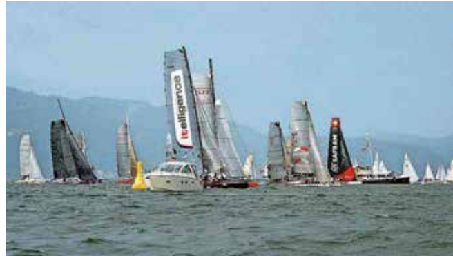
Schon beim Start dominierten die grossen Katamarane die Szenerie auf dem See vor Lindau.